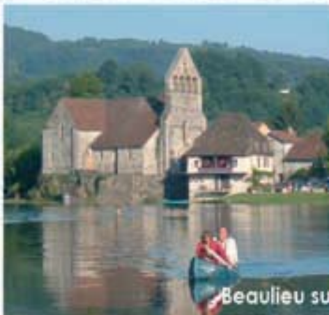
Beaulieu sur Dordogne

Le Camping est situé à 4kms de Beynat à 500m d'altitude.