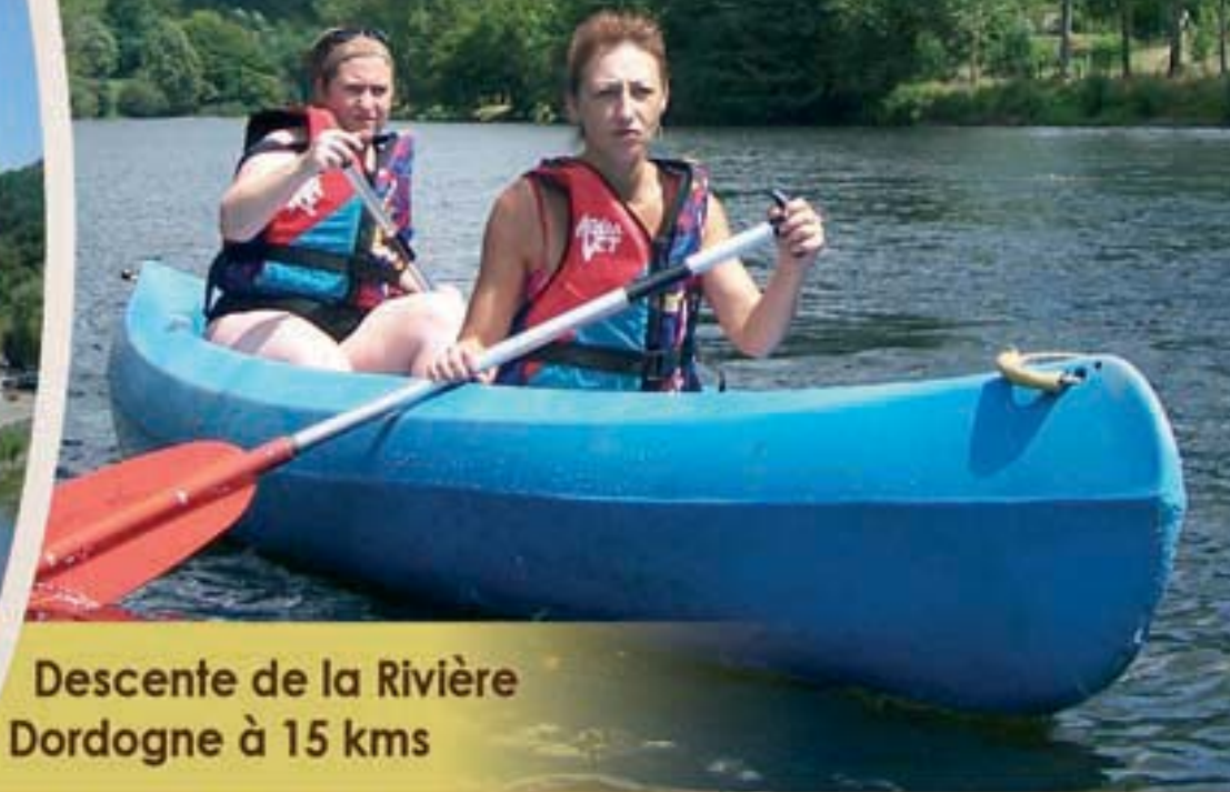
Descente de la Rivière Dordogne à 15 kms